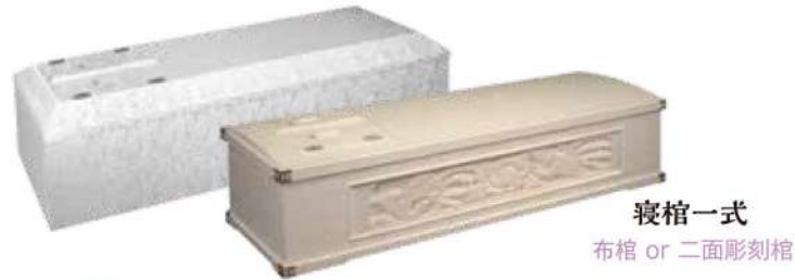
寝棺一式 布棺 or 二面彫刻棺