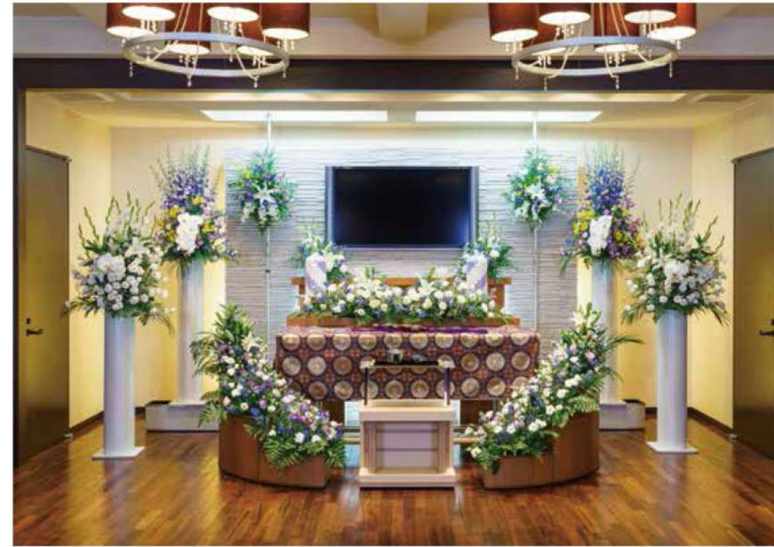
※祭壇は一例です。宗派別に飾り付け等、実際と異なる場合があります。